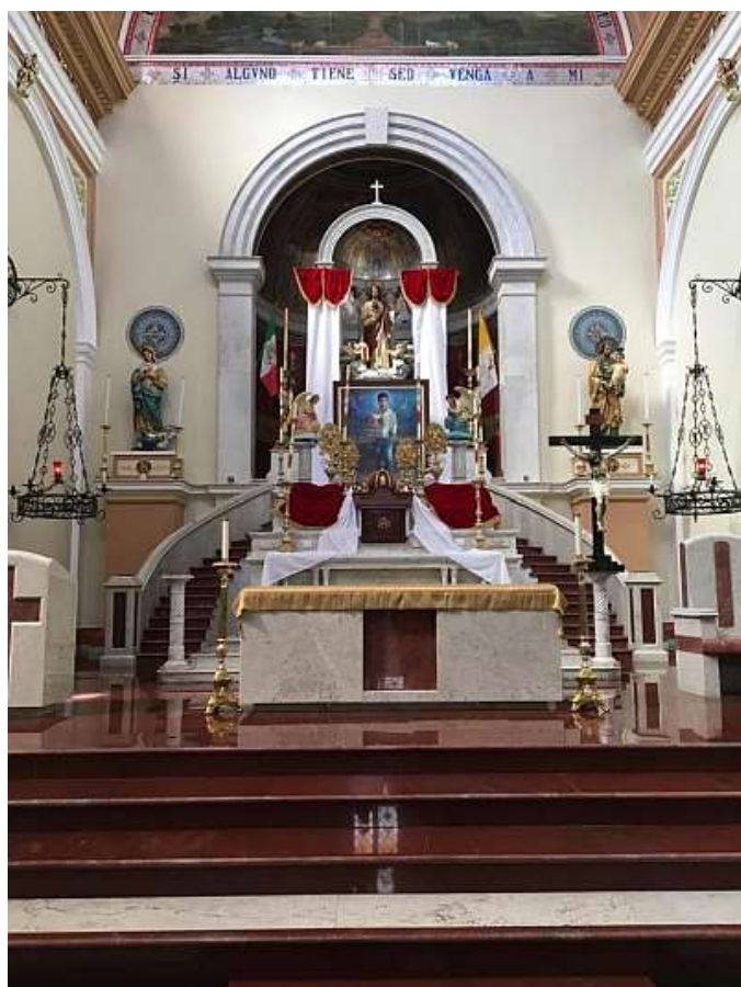
Altare del Santo