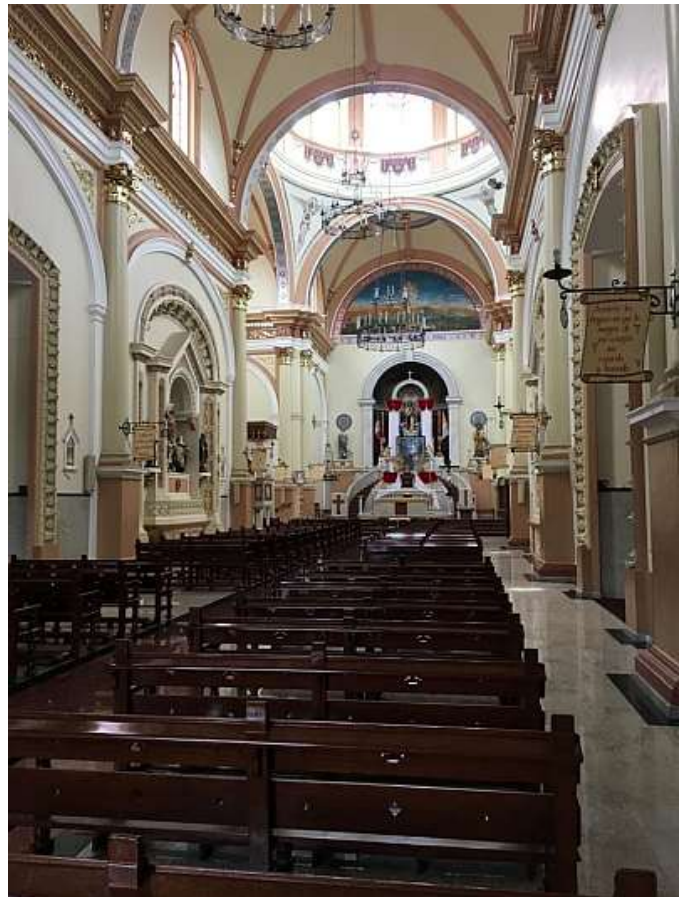
Il Santuario del Sacro Cuore di Gesu'