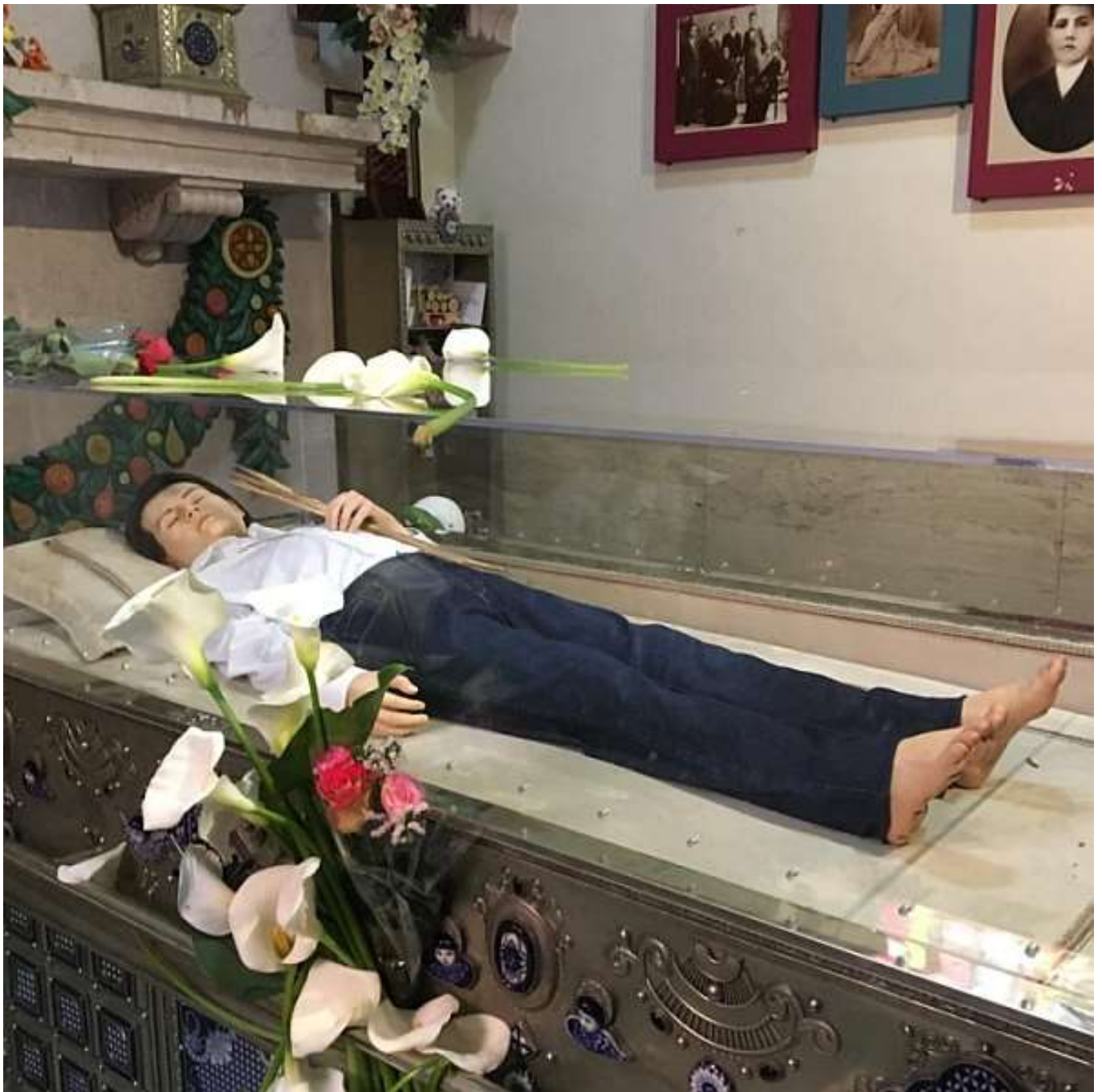
Immagine del corpo di San Joselito in cera (Battistero della sua Parrocchia di S. Giacomo)