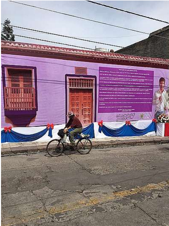
Luogo di casa Sanchez del Rio (demolita)