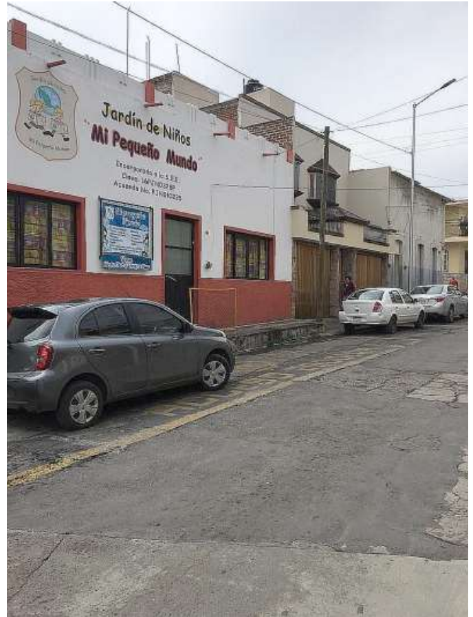
Casa Picazo (conservata)