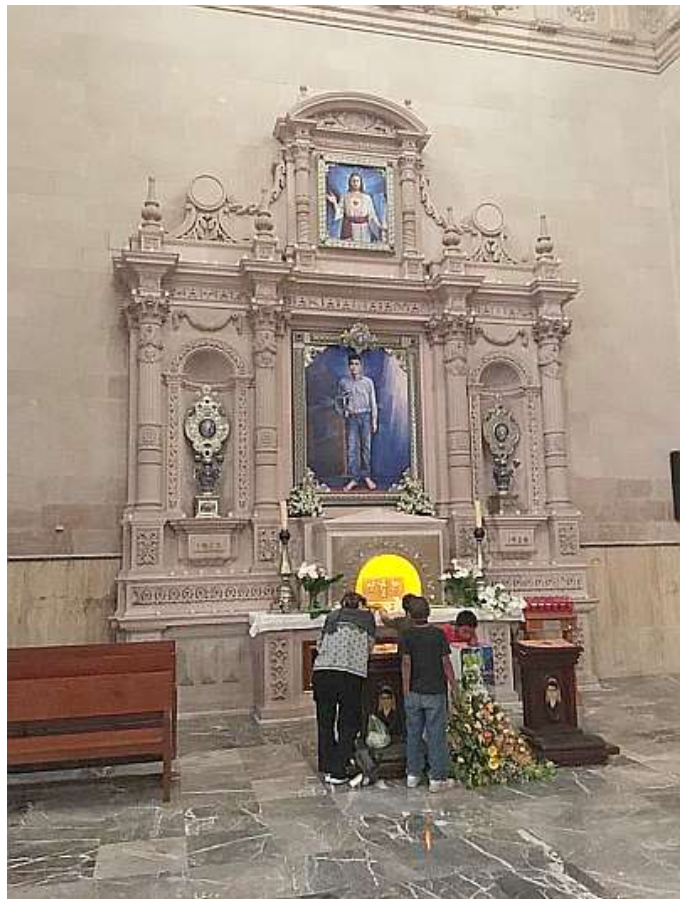
Chiesa Parrocchiale di San Giacomo e Altare del Santo