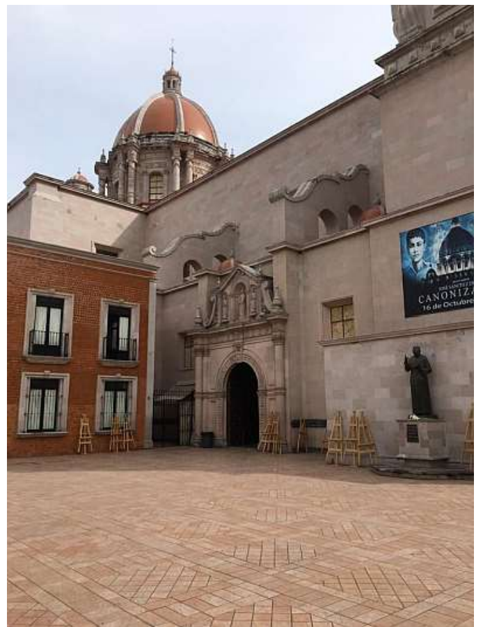
Finestra del battistero e porta laterale da cui fu fatto uscire