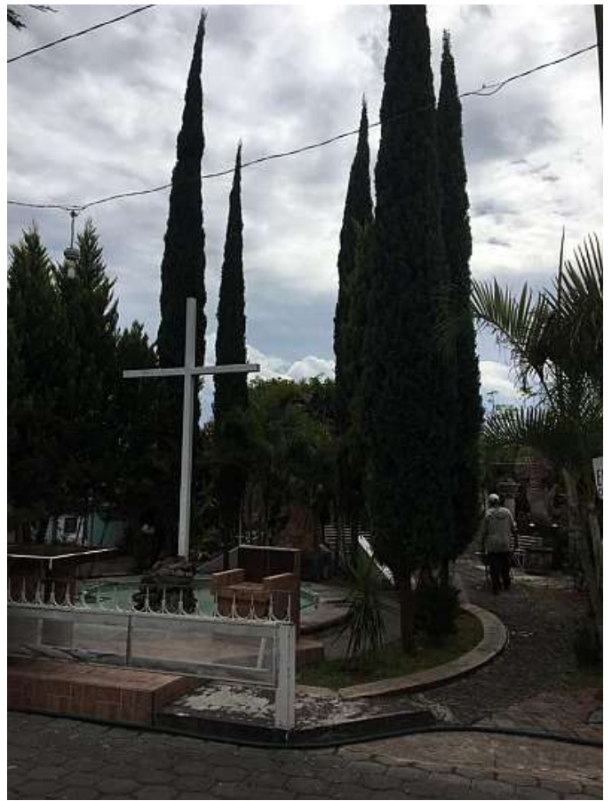
Luogo del martirio